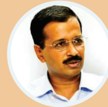
Shri Arvind Kejriwal Chief Minister, Delhi

The parking at Chandni Chowk is an important infrastructure project. Chandni Chowk is visited by traders and shoppers in large numbers and with the completion of this project, the beauty of Chandni Chowk will be enhanced and the experience of shopping and parking will be eased. I am sure other projects that are being developed in this jurisdiction will also take inspiration and expedite their construction and completion on time.