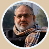
Shri Jai Prakash Mayor, North Delhi Municipal Corporation

The revamped 1.3 km stretch between Red Fort and Fatehpuri Masjid in Chandni Chowk, slated to open in the first week of November 2020.